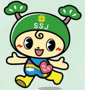
事業団イメージキャラクター 「ふくまつちゃん」